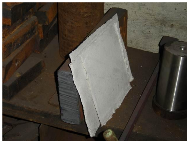
4.attēls. Azbesta kartons