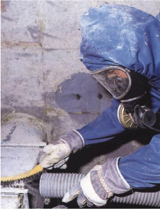
8.attēls. Aizsargapģērbs un individuālie aizsardzības līdzekļi darbam ar azbestu