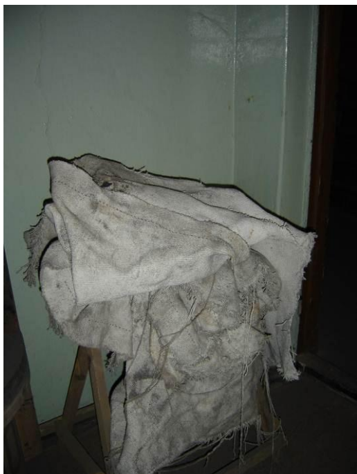
1.attēls. Azbesta audums