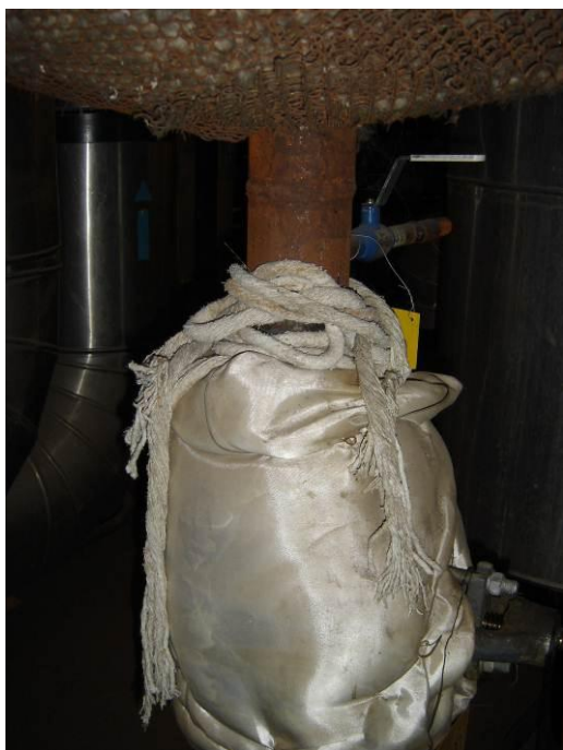
3.attēls. Azbesta auklas