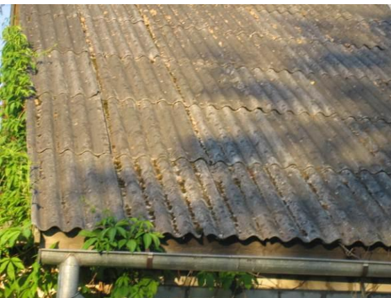
7.attēls. Azbestu saturošs šiferis kā jumta segums