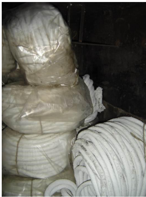
2.attēls. Azbesta šņores