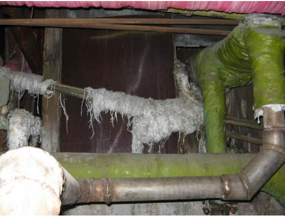
5.attēls. Bojāta azbestu saturoša siltumizolācija