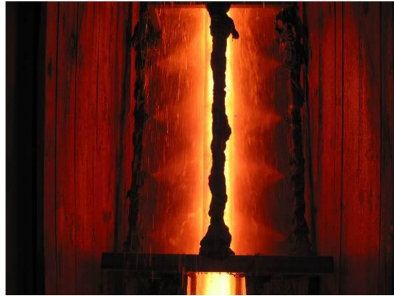
6.attēls. Azbests kā ugunsizturīgs materiāls